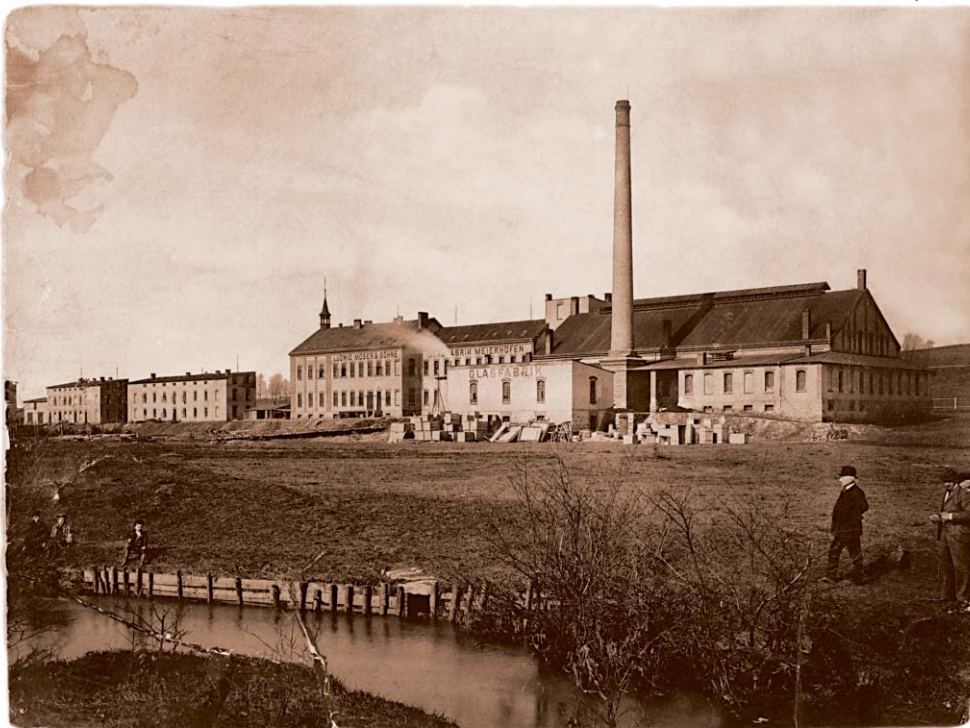
Sklárna Moser, 1895

© zrod sklárny Moser se zasloužil Ludwig Moser (1833–1916), tvořivý a talentovaný rytec, který roku 1857 založil v lázeňském městě Karlovy Vary firmu nesoucí jeho jméno. Sklárna se dále úspěšně rozvíjela díky dalším generacím karlovarských sklářů, jež do skla vkládali své představy o sklářském umění.