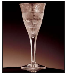
Splendid 10160/OP Alžběta II., anglická královna

Foukané, zlacené, ručně broušené nebo ryté nápojové soubory jako například Maharani, Paula, Splendid, Pope (Papež) a Lady Hamilton, navržené na přelomu 19. a 20. století, jsou stejně atraktivní dnes jako v době, kdy byly vyrobeny poprvé. Sklo Moser jedinečně doplňuje a dodává lesk slavnostním jídelním soupravám nejlepších a nejexkluzivnějších světových výrobců. V historických i nově vytvořených kolekcích se snoubí vysoká umělecká úroveň s dokonalým řemeslným zpracováním, které zaručují jejich trvalou hodnotu. V široké škále souborů, od jednoduše elegantních, jakými jsou například Mozart a Ophelia, až po náročně tvarované a dekorované soubory Baroque nebo Maria Theresia, si každý zákazník vybere ten svůj.