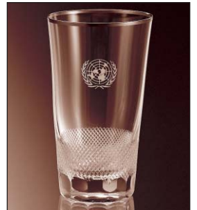
Royal 9000/PO OSN, New York