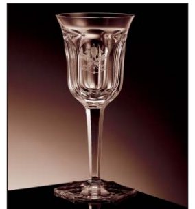
Pope 11520/PO Papež Pius XI.