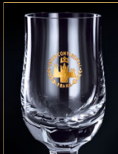
Hotel Intercontinental Praha HOTEL INTERCONTINENTAL PRAGUE