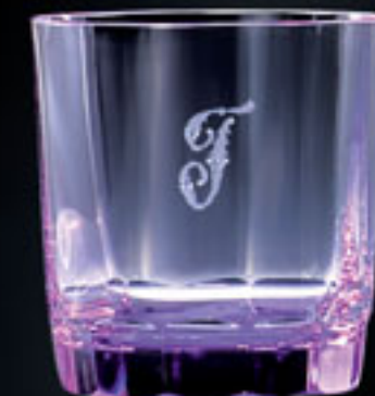
Monogram „J“ MONOGRAM „J“