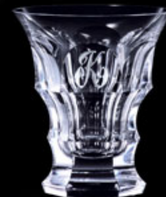
Monogram „K“ MONOGRAM „K“