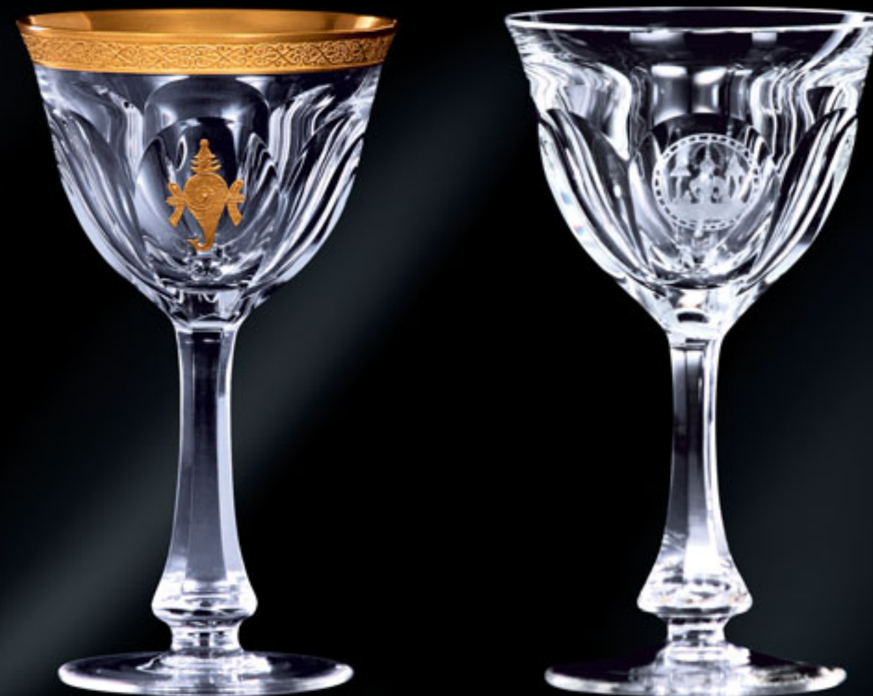
Maháradža z Travancore MAHARAJAH OF TRAVANCORE