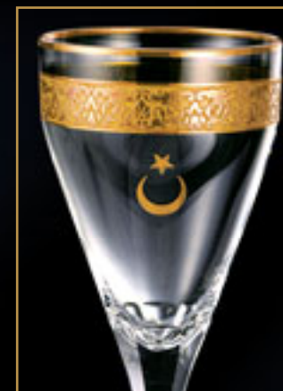
Diplomatické mise Turecka DIPLOMATIC MISSIONS OF TURKEY