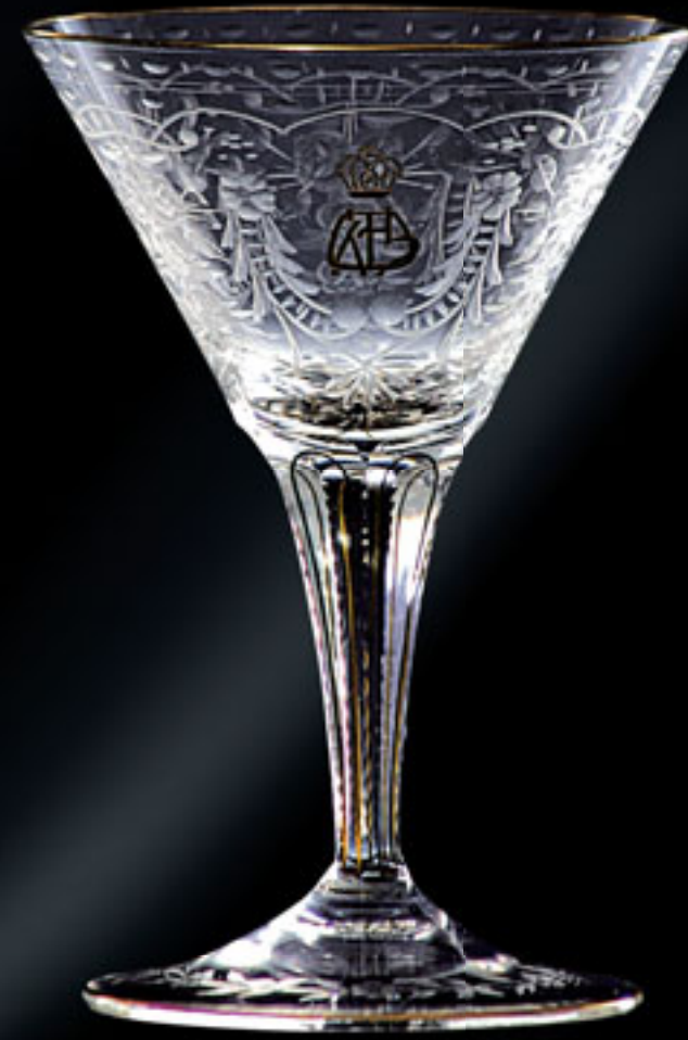
Asfa Wossen, etiopský korunní princ CROWN PRINCE ASFA WOSSEN OF ETHIOPIA