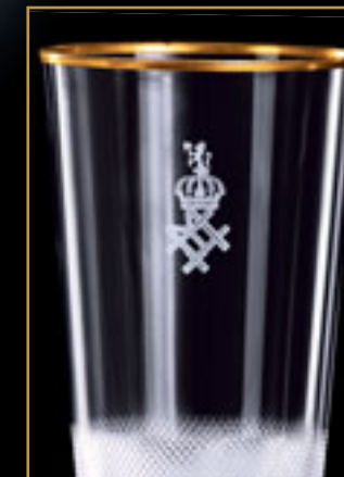
Norský král Haakon VII. KING HAAKON VII OF NORWAY