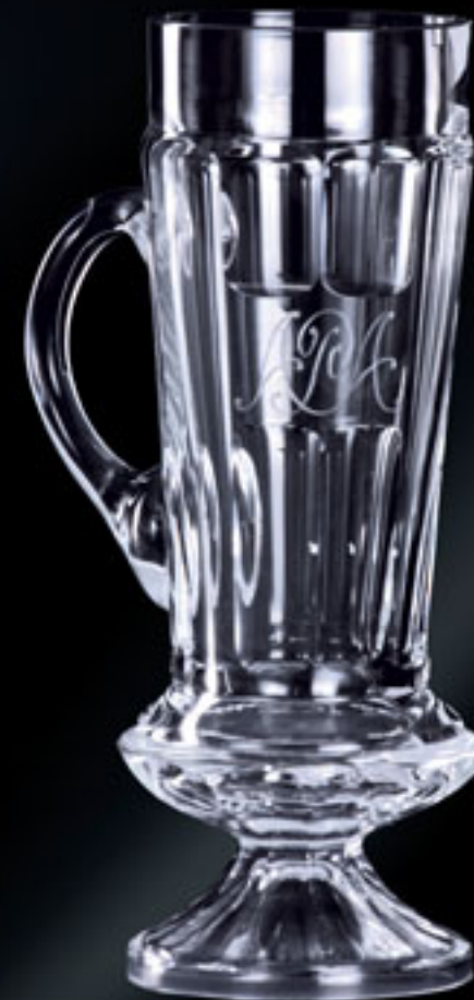
Monogram „APA“ MONOGRAM „APA“