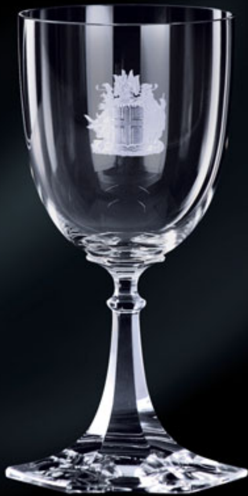
Prezident Islandu PRESIDENT OF ICELAND