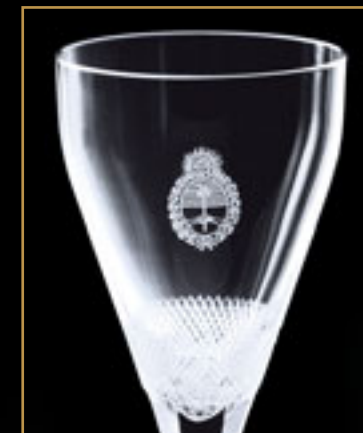
Diplomatická mise Argentina DIPLOMATIC MISSION OF ARGENTINA