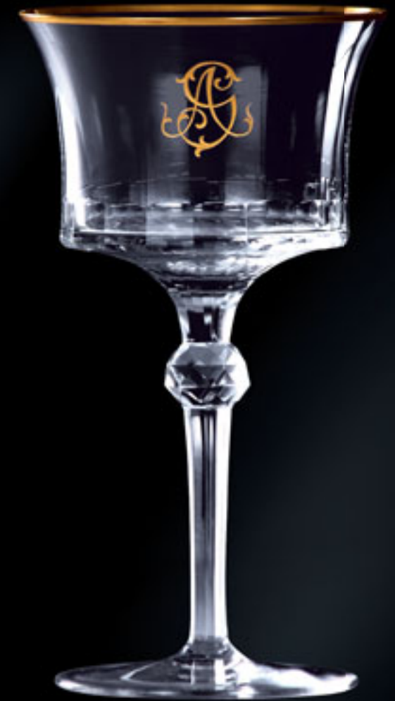
Monogram „AS“ MONOGRAM „AS“