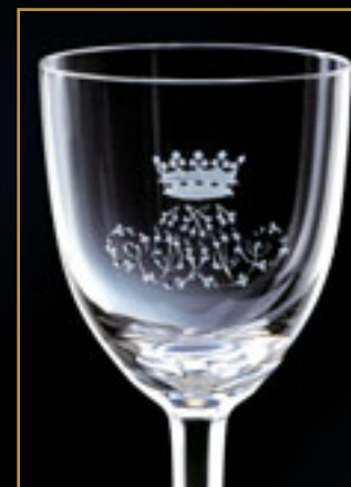
Vévoda z Marlborough DUKE OF MARLBOROUGH