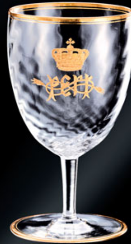
Victor Emanuel, italský král VICTOR EMANUEL, KING OF ITALY