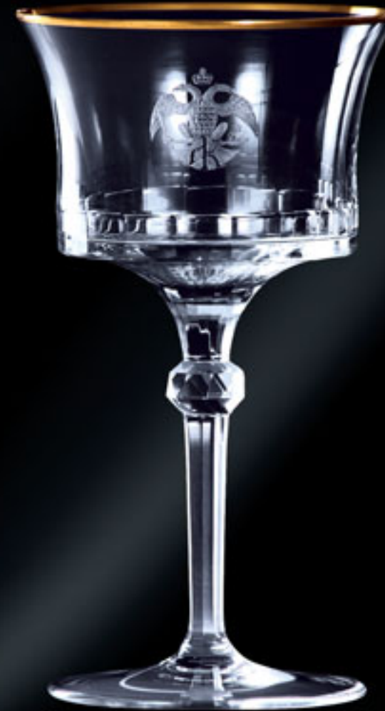
Makarios, prezident Kyperské republiky MAKARIOS, PRESIDENT OF THE REPUBLIC OF CYPRUS