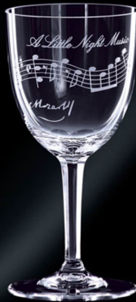
W. A. Mozart „Malá noční hudba“ W. A. MOZART "A LITTLE NIGHT MUSIC"