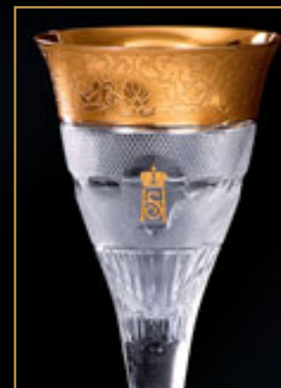
Norský královský pár, Harald a Sonja ROYAL COUPLE OF NORWAY, HARALD AND SONJA