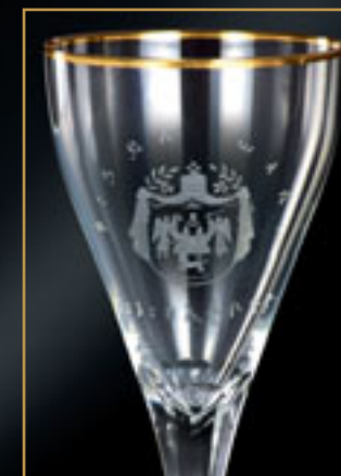
Etiopský císař Haile Selassie EMPEROR HAILE SELASSIE OF ETHIOPIA