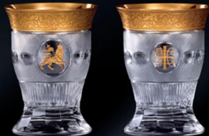
Etiopský císař Haile Selassie (přední a zadní pohled) EMPEROR HAILE SELASSIE OF ETHIOPIA (FRONT AND BACK VIEW)