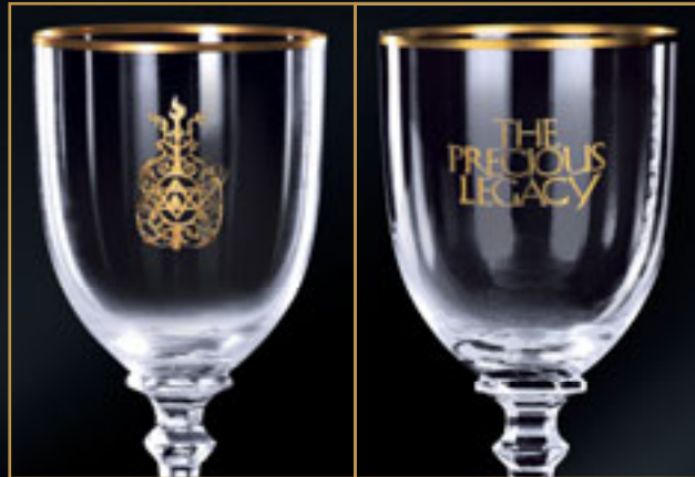
Židovská synagoga (přední a zadní pohled) JEWISH SYNAGOGUE (FRONT AND BACK VIEW)