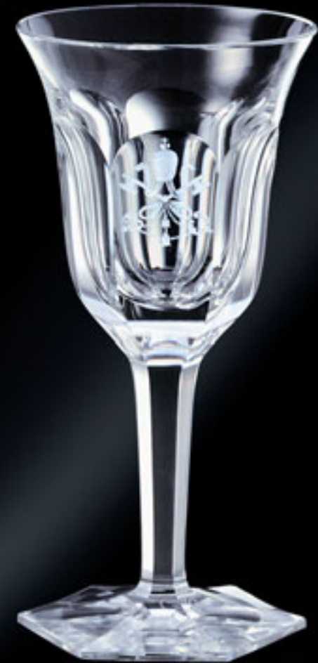
Papež Pius XI. POPE PIUS XI