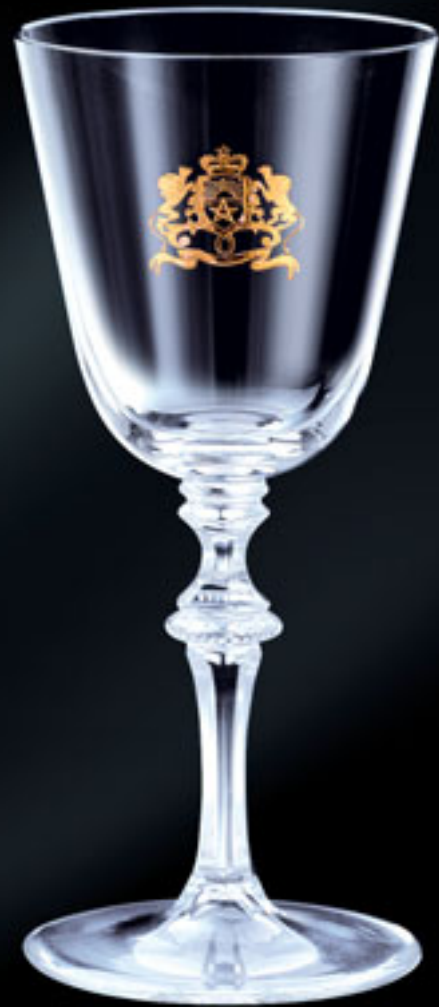
Marocké království KINGDOM OF MOROCCO