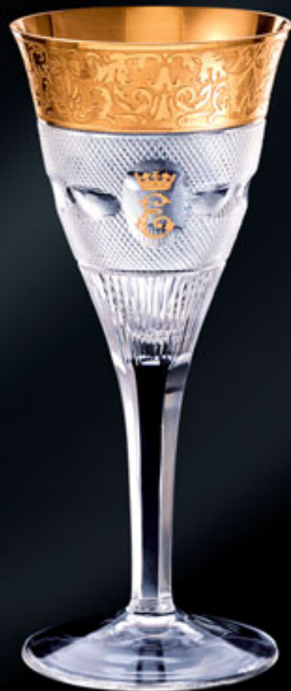
Anglická královna Alžběta II. ENGLISH QUEEN ELISABETH II