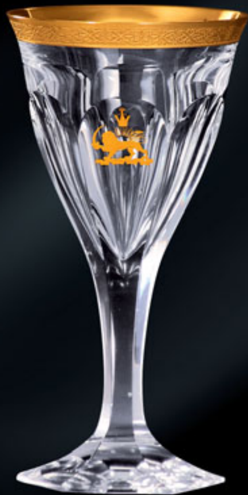
Íránský šáh Mohammed Reza Pahlavi SHAH MOHAMMED REZA PAHLAVI OF IRAN