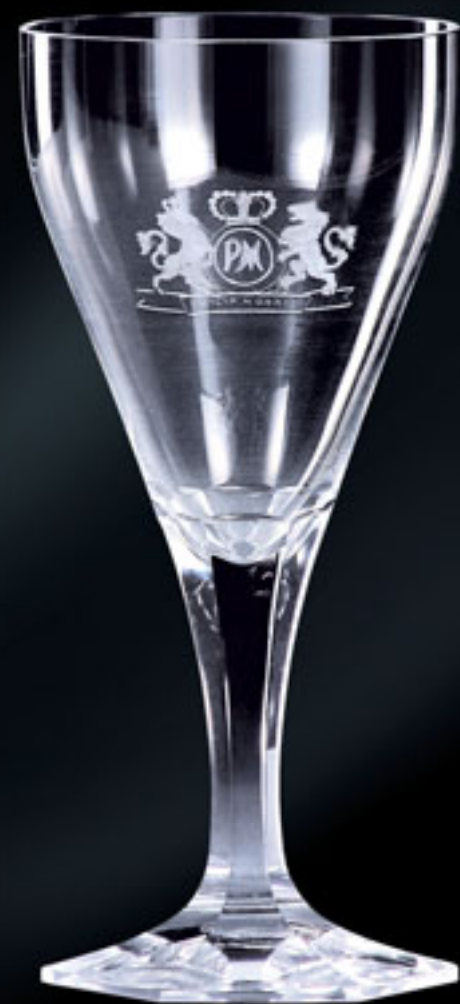
Philip Morris PHILIP MORRIS