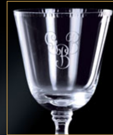
Barbara a George Bushovi BARBARA AND GEORGE BUSH