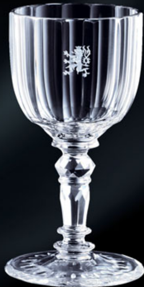
Ministerstvo zahraničí Československa CZECHOSLOVAK MINISTRY OF FOREIGN AFFAIRS