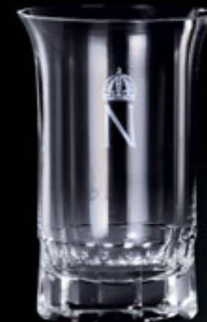
Monogram „N“ s korunkou MONOGRAM „N“ WITH CROWN