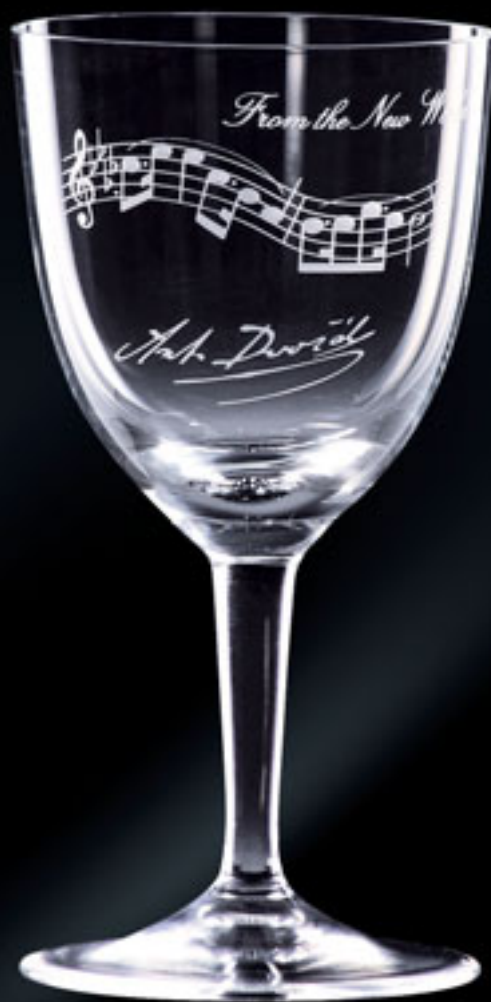
Antonín Dvořák „Z Nového světa“ ANTONÍN DVOŘÁK "FROM THE NEW WORLD"