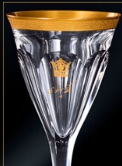
Perská císařovna EMPRESS OF PERSIA