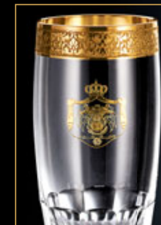
Jordánský královský palác JORDAN PALACE