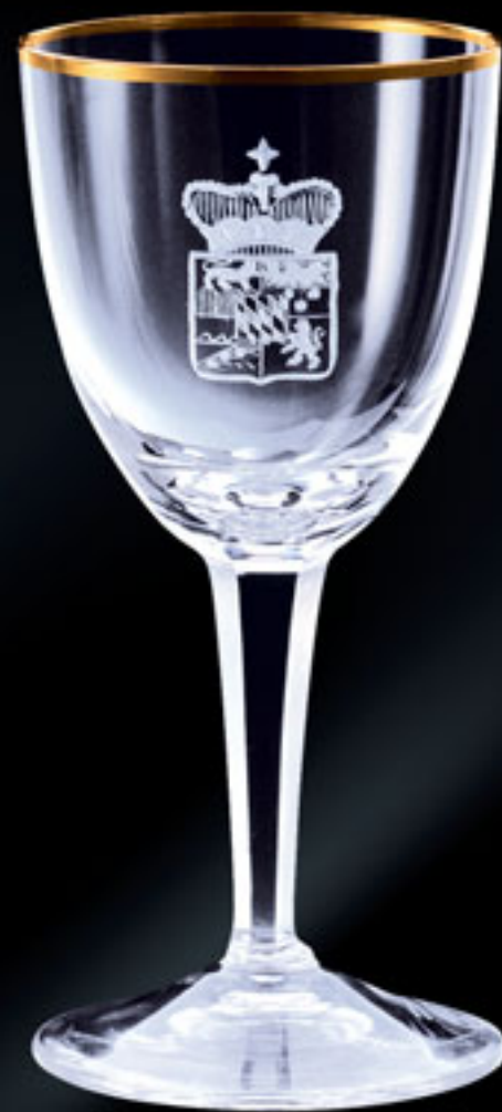
Princ Löwenstein PRINCE LOEWENSTEIN