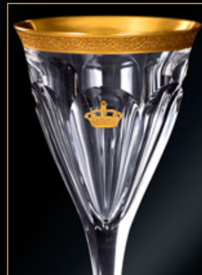
Egyptské království KINGDOM OF EGYPT