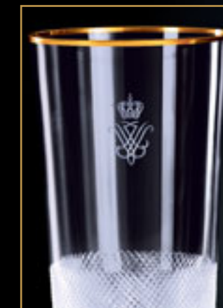
Norský král Harald V. KING HARALD V OF NORWAY