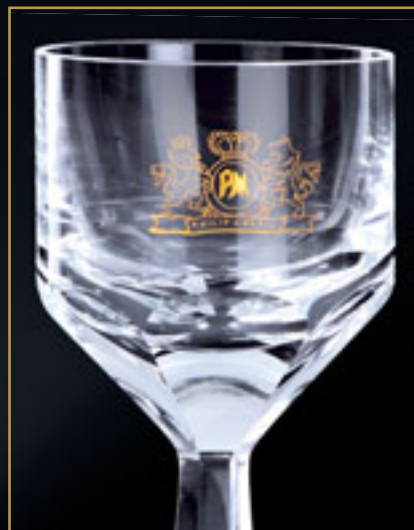
Philip Morris PHILIP MORRIS