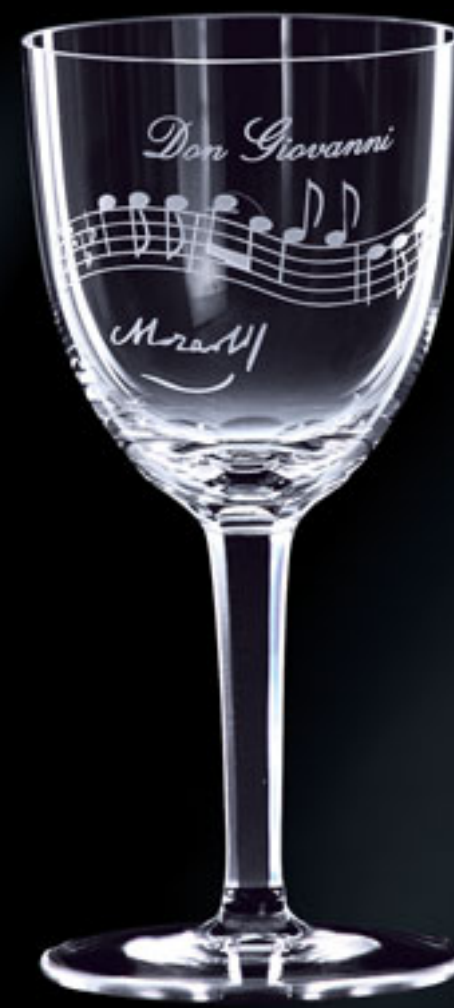
W. A. Mozart „Don Giovanni“ W. A. MOZART "DON GIOVANNI"