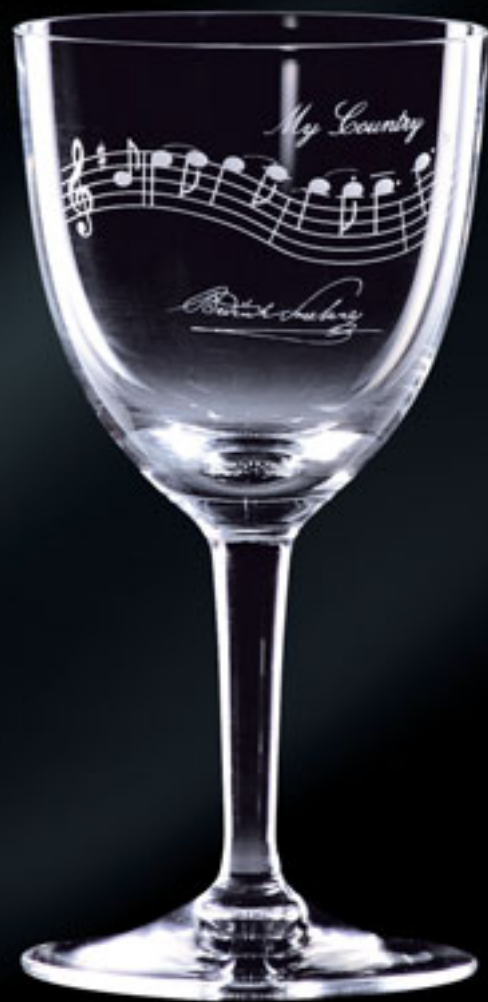
Bedřich Smetana „Má vlast“ BEDŘICH SMETANA "MY COUNTRY"