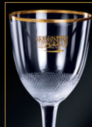
Saudská Arábie SAUDI ARABIA