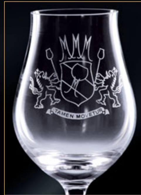
Klub Moser CLUB MOSER