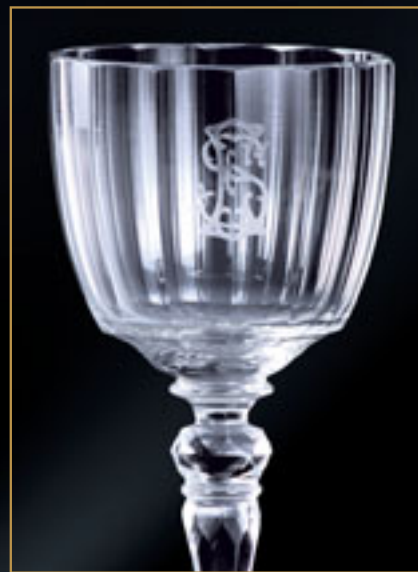
Italská herečka Sophia Loren ITALIAN ACTRESS SOPHIA LOREN