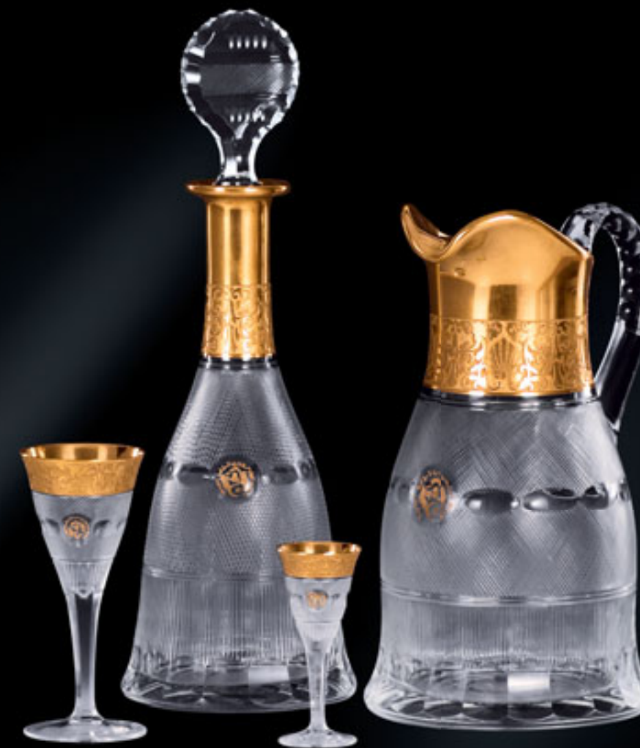
Prezidentský palác v Alžíru PRESIDENT'S PALACE IN ALGERIA