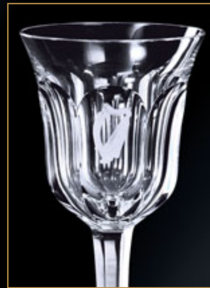
Irská republika REPUBLIC OF IRELAND