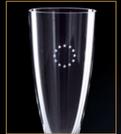
Evropská unie THE EUROPEAN UNION