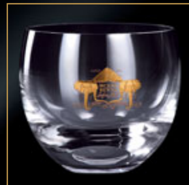
Mount Kenya Safari Club MOUNT KENYA SAFARI CLUB