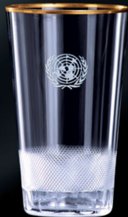
Organizace spojených národů v New Yorku UNITED NATIONS IN NEW YORK