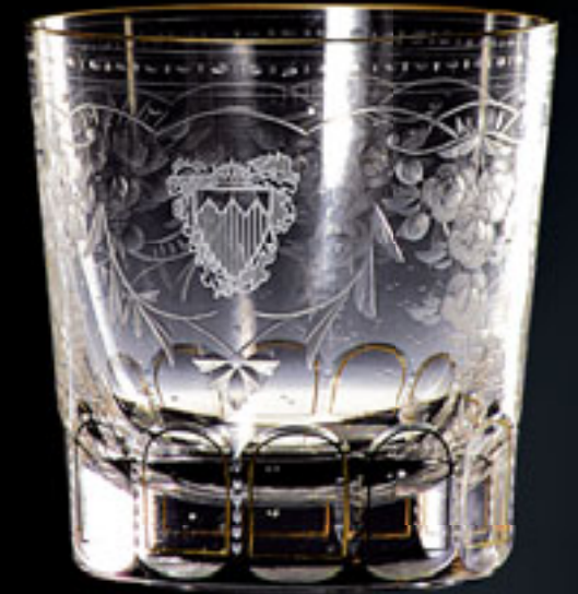
Královský palác v Bahrajnu ROYAL PALACE OF BAHRAIN