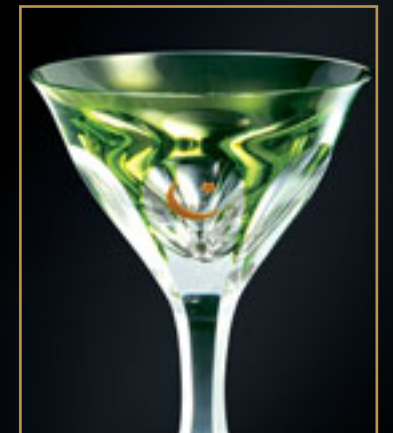
Pákistánská vláda GOVERNMENT OF PAKISTAN