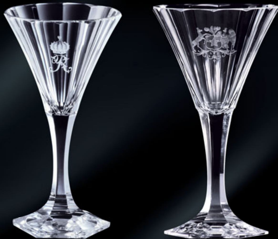
Maháradža z Rampuru MAHARAJAH OF RAMPUR