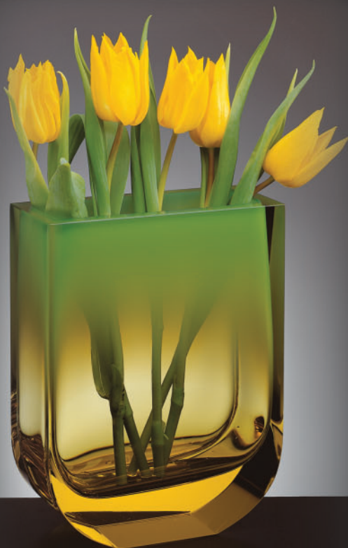
Podjímaná váza Podzim Underlay vase Autumn