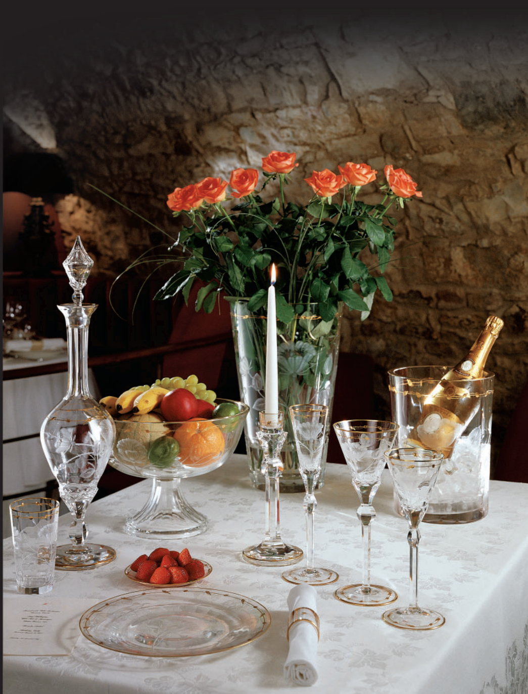
Table set Paula