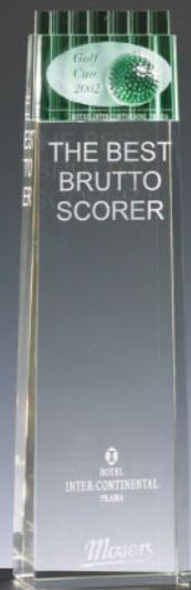
Trofej - golfová cena Trophy - golf prize