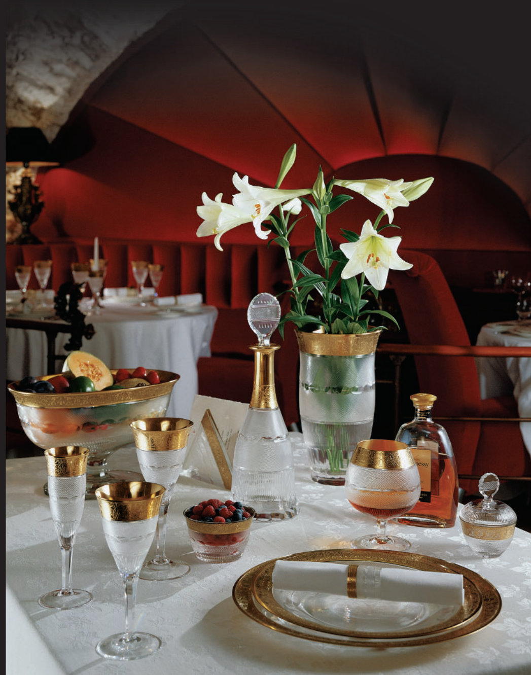
Nápojový soubor Splendid