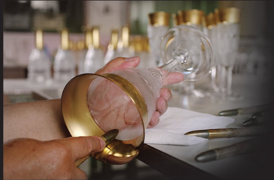
Leštění zlata Gold polishing