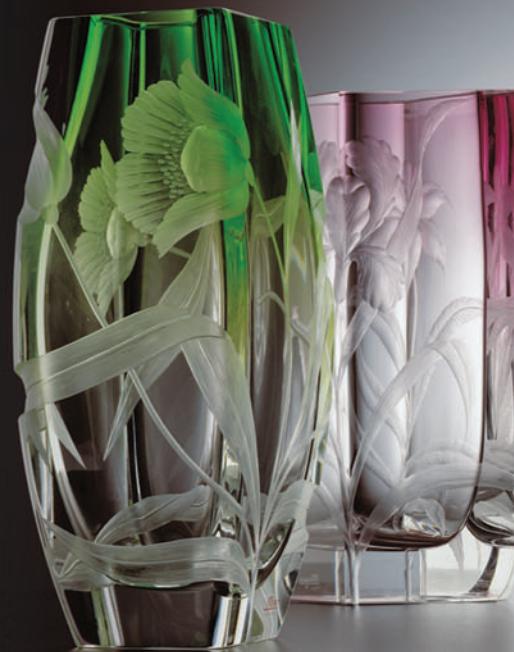
Ryté secesní vázy Engraved Art Nouveau vases