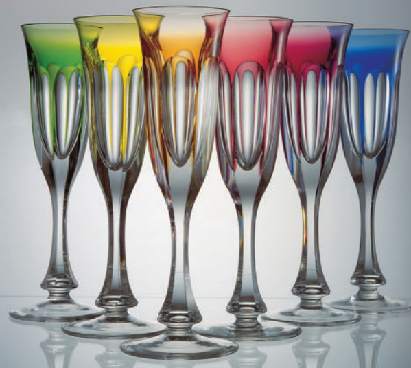
sada přejímaných fléten set of overlay flutes