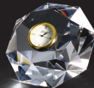
Hodiny Diamant Clock Diamond