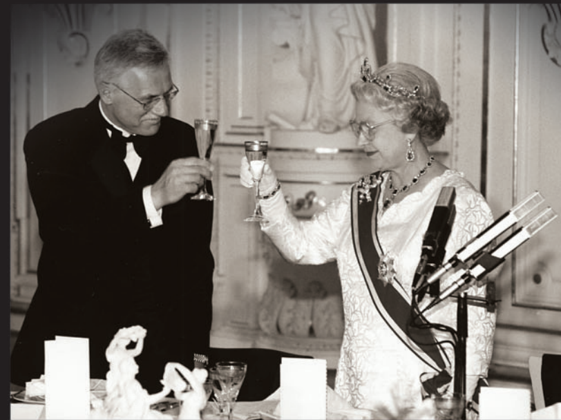
Královna Alžběta II. a Václav Klaus Queen Elizabeth II and Václav Klaus