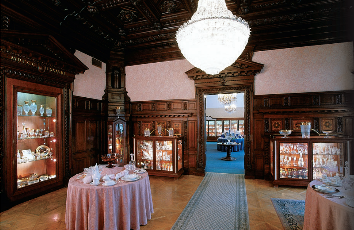
Reprezentativní prodejna Moser v Praze Na Příkopě 12 Moser Flagship store in Prague Na Příkopě 12