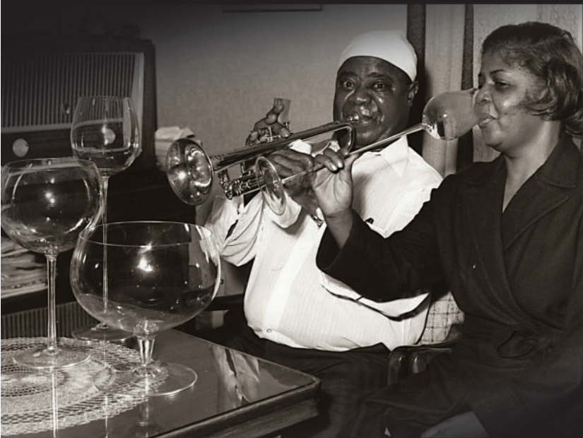
Louis Armstrong s manželkou Louis Armstrong with his wife