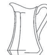
11539 džbán / jug C: 1000ml / 1 qt. H: 23,7cm / 9.3 inch