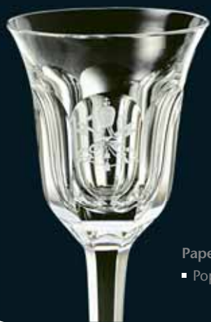
Papež Pius XI. ▪ Pope Pius XI