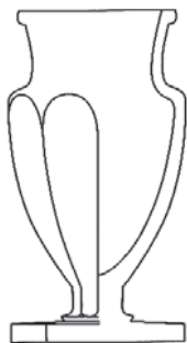
624/11520 váza / vase H: 40 cm / 15.7 inch