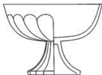
540/11520 jardiniéra / jardinière H: 19,4 cm / 7.6 inch W: 27 cm / 10.6 inch