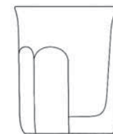
11520/E/I ledák / ice bucket H: 24cm / 9.4 inch W: 20cm / 7.9 inch