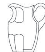
13899/I džbán / jug C: 1000 ml / 1 qt. H: 21,7 cm / 8.5 inch