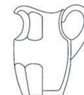
13899 džbán / jug C: 1500 ml / 1.5 qt. H: 23,3 cm / 9.1 inch